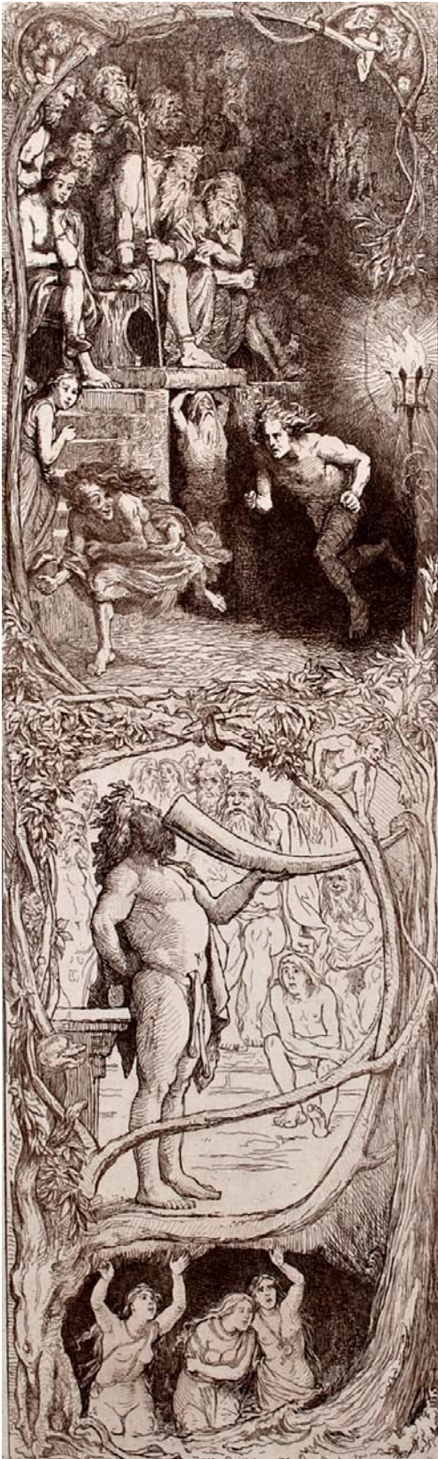
I Lorenz Frølichs tryk fra 1872 synes det endnu realistisk, at Thor skulle kunne tømme drikkehornet – sært er det, at han ikke kunne mærke, at han havde drukket så meget, at han nær havde tømt verdenshavet!