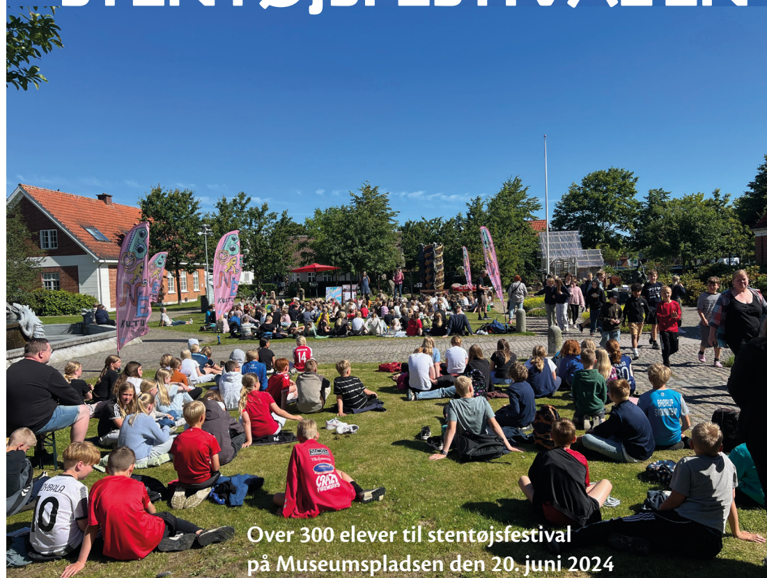
Over 300 elever til stentøjsfestival på Museumspladsen den 20. juni 2024