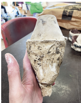
▶ Eksempler på overbygninger, hvor skålene har fået "hoveder".