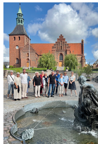
Museets personale på udflugt ved Niels Hansen Jacobsens Havfruespringvand på Torvet i Svendborg.