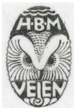
Udkast til bomærke for Bruun-Møllers Boghandel. Ca. 1915.