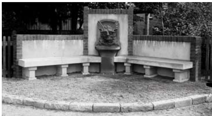
Springvandsmasken, som den tog sig ud i sandsten på Bane-gårdspladsen i Vejen. Bemærk slægtskabet til masken over atelierdøren på fotografiet på modsatte side.