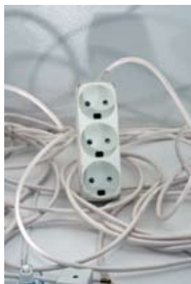
Har du nogensinde set "masken" i bunden af en stikdåse?