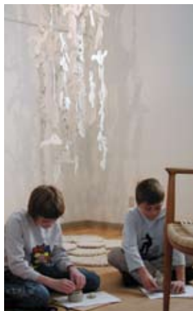
Et par elever arbejder med små modelleringsopgaver i udstillingen "Bagværk med glasur", årets julekalenderudstilling hen over årsskiftet 2003-2004.

Årsagen til besøget er for mange en familieudflugt. Ofte kombinerer lokale borgere familieselskab med en travetur til museet, som de viser frem for familie, venner og bekendte. Den næsthypigste årsag er opfølgning på tidligere besøg. Det betyder (hvad gæstebogen også afslører), at de har haft en god oplevelse og vender tilbage efter mere. Næsten dobbelt så mange kommer på anbefaling som de, der kom