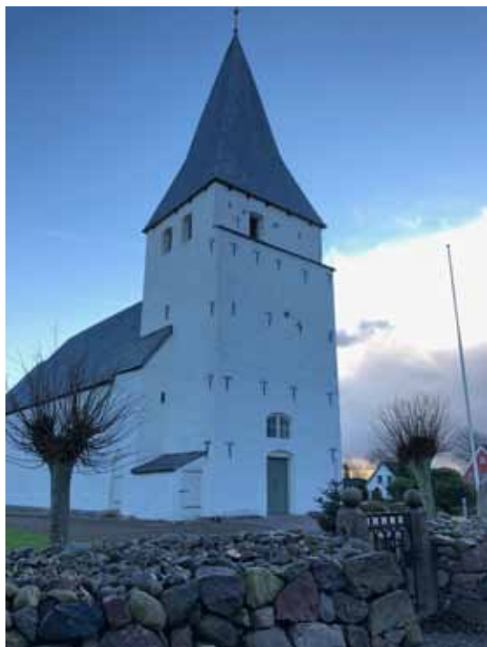
▼ Lintrup Kirke